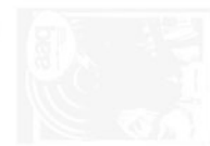
Architectural Association October 1970 Herbst 1970 London