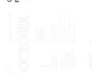
October Nr. 1 Frühjahr 1976 New York