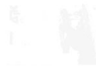
Amc: Architecture Mouvement Continuité Nr. 43 1977, Paris