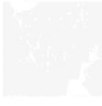
Aujourd'hui: Art et Architecture Nr. 50, Juli 1965 Paris