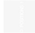
Oppositions Nr. 1 September 1973 New York