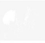
Domebook 2 Bolinas Kalifornien